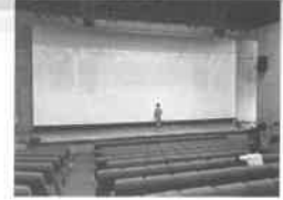
劇場内のスクリーン