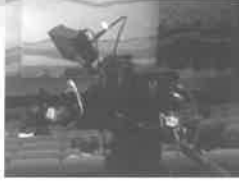
高精細8Kカムコーダ