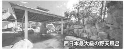
西日本最大級の野天風呂