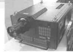
世界最高峰の8Kプロジェクター